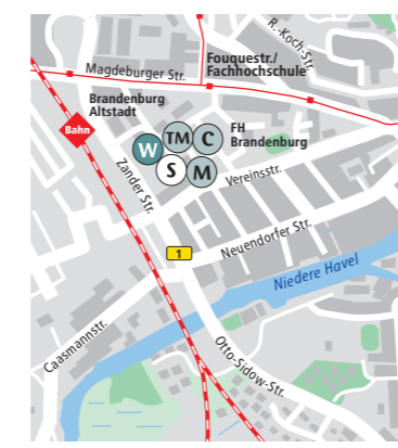
› Lageplan: Brandenburg