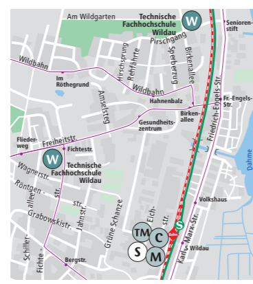
› Lageplan: Wildau